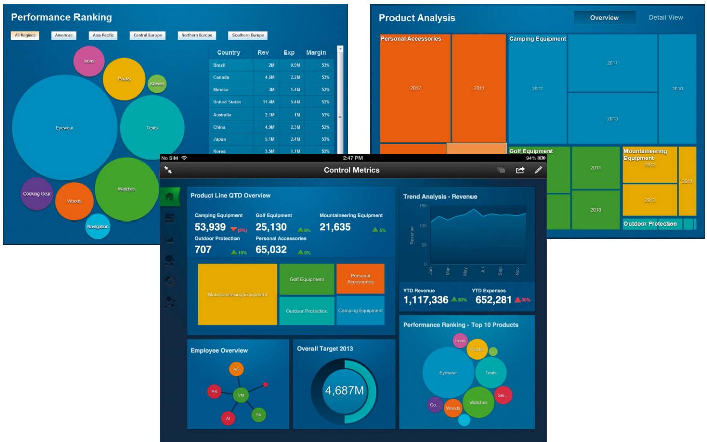
Рисунок 2. Интуитивно понятный, простой в использовании интерфейс предоставляет полный доступ к отчетам и средствам анализа в режиме самообслуживания. Пользователи могут получать и использовать знания о бизнесе на своих ПК и мобильных устройствах для повышения мобильности и гибкости.